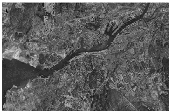
Flygbild över Göteborg ca 1960

Denna studie undersöker de huvudsakliga syftena som låg till grund för expropriation under 1960-talet i Göteborg. Expropriation är ett planeringsverktyg som inskränker individens lagstadgade rätt att förfoga över sin egendom. Beslut om expropriation fattas då man menar att valet att exproprieras kommer att bidra till ett bättre samhälle, att det är för det allmännas bästa. Det finns dock få studier som undersöker mark som exproprierats, här har därmed en kunskapslucka identifierats.