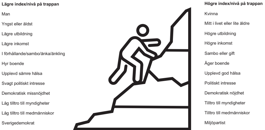
Figur 2 Sammanfattande illustration av faktorer som leder till jämförelsevis högre respektive lägre index/nivå på trappan för hemberedskapsengagemang, 2023

Kommentar: Sammanfattande illustration av slutsatser rörande högre eller lägre nivåer av index och steg som redovisas i tabell 3 och tabell 4. Samband som presenteras på detta översiktliga vis skiljer sig åt i styrka.