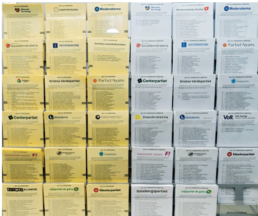
Valsedlar i Göteborg till Riksdagsvalet och Kommunfullmäktigevalet 2022.

i slutskedet av en valrörelse och överväger röstning på två partier. Detta genomsnitt har förändrats mycket litet under perioden 2006-2022 (Boije, Oscarsson & Oskarson, 2015).