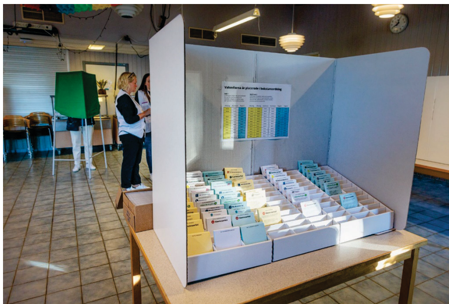
Svenska väljare ska fatta tre partivalsbeslut vid samma tillfälle. Vid valet 2022 användes särskilda avskärmingar där väljarna ostört kunde plocka en gul, vit och blå valsedel.