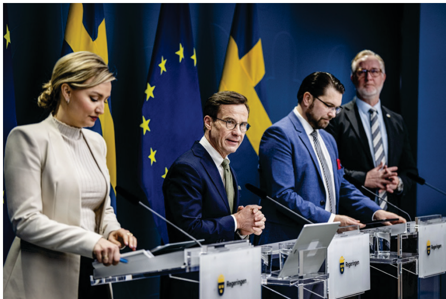
Tidö-partierna håller presskonferens efter 100 dagars regering den 26 januari 2023.

2026 års val. Framtiden får utvisa vad konsekvenserna av denna uppfattat höger-tunga Tidö-politik blir. Åtminstone två scenarier är möjliga: antingen anpassar väljarna sig efter den förda regeringspolitiken och följer den sittande regeringen längre högerut. Eller behöver regeringen anpassa sin politik under resans gång så att den inte uppfattas bedrivas så långt till höger att den skapar så kallade termostateffekter där väljarna protesterar genom att dra undan sitt stöd vid nästa val.