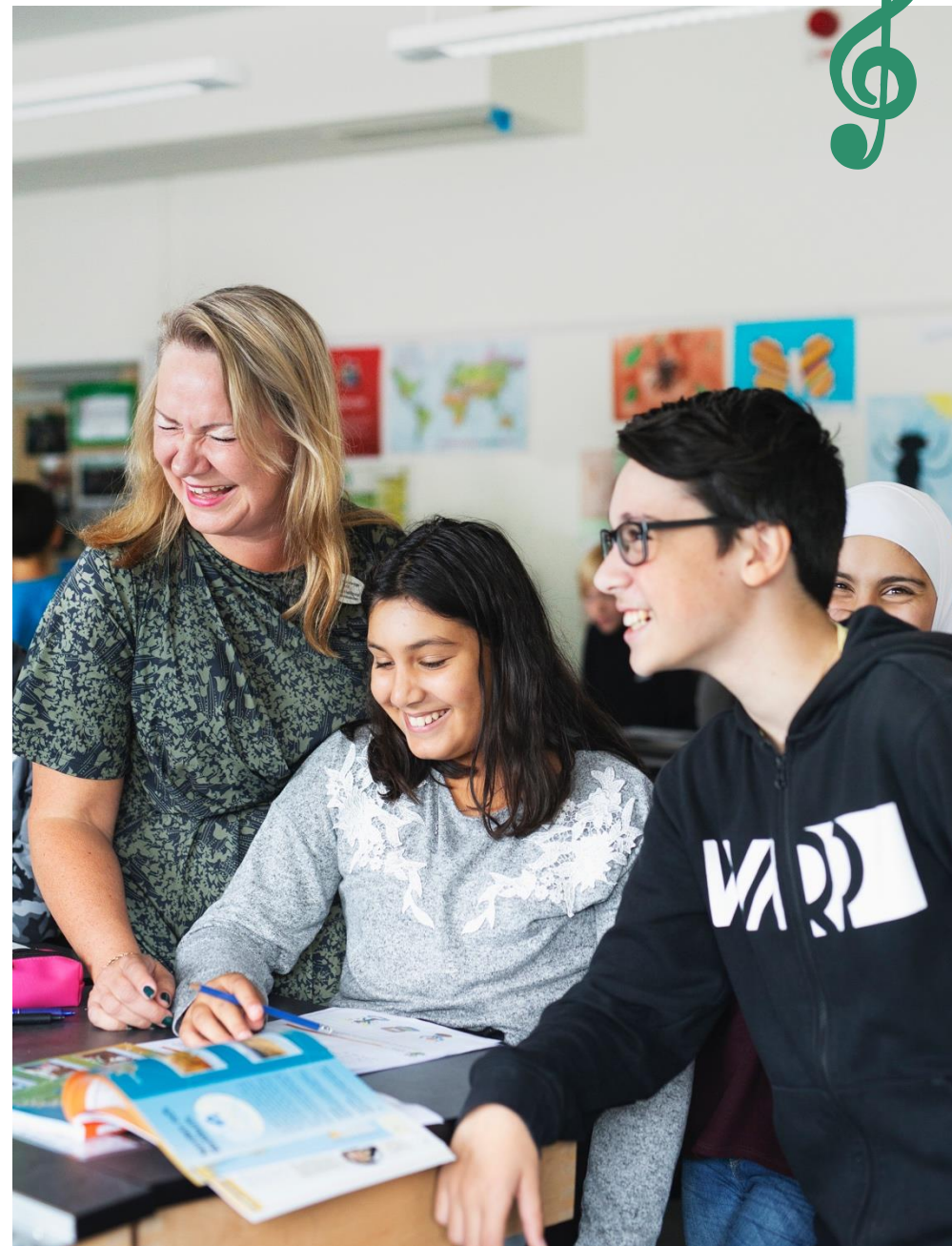
Byt till en bild på er skola och ta bort denna text.

Från och med VFU 2 får du tillgång till digitala lärvverktyg som Google Workspace for Education. Här kan du läsa mer: Grundskoleförvaltningen - Handbok för VFU-studenter (google.com) . Har du frågor kontakta kompetensforsorjning.grundskola@goteborg.se , eller din handledare.