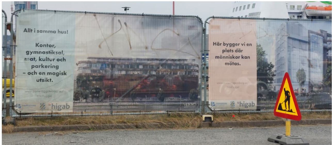
När Kommersen i Göteborg revs och Masthuggskajen utvecklades var planen att göra plats för delningsinitiativ, men så blev det inte.