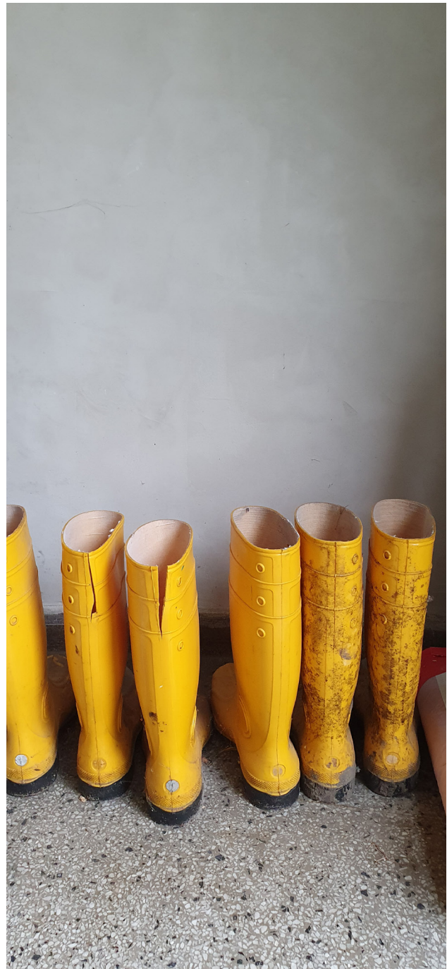
I Haus des Wandels utanför Berlin arbetas det kollektivt, praktiskt och kulturellt för ett hållbart samhälle med rum för alla.

Kanske visar det nytta av vårt försök att utveckla en teori om hur gräsrotsinitiativ väljer strategier. Resultatet visar att strategivalen oftast överensstämmer med vår generaliserade förutsägelse, men där avvikelser sker kan det finnas skäl för oss som forskare att söka djupare förklaringar – och kanske för gräsrotsinitiativen att reflektera över sina strategival.