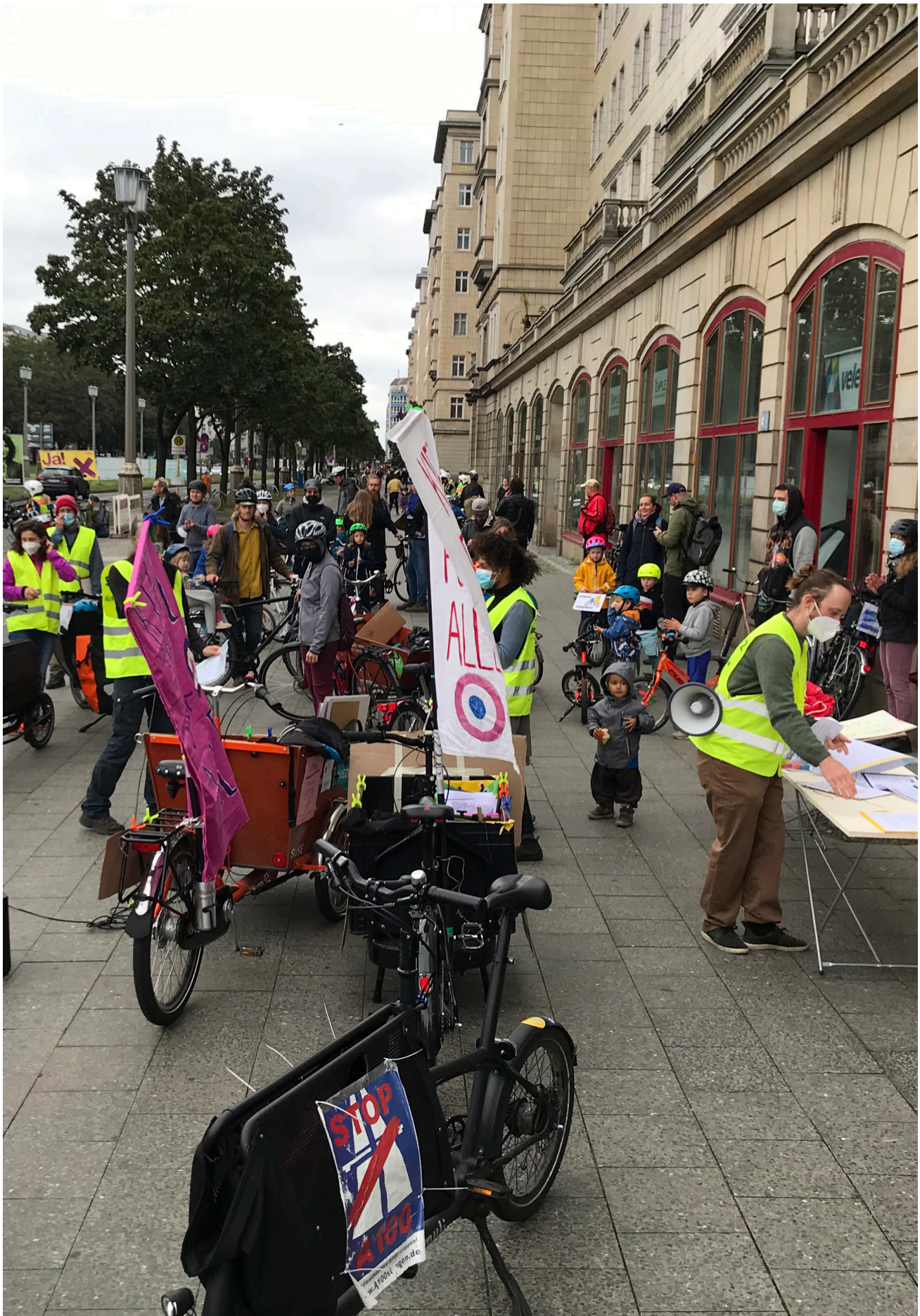
En så kallad Kidical Mass – cykeldemonstration med barn, föräldrar och andra – med budskapet att stadens gator bör vara farbara även för barn.