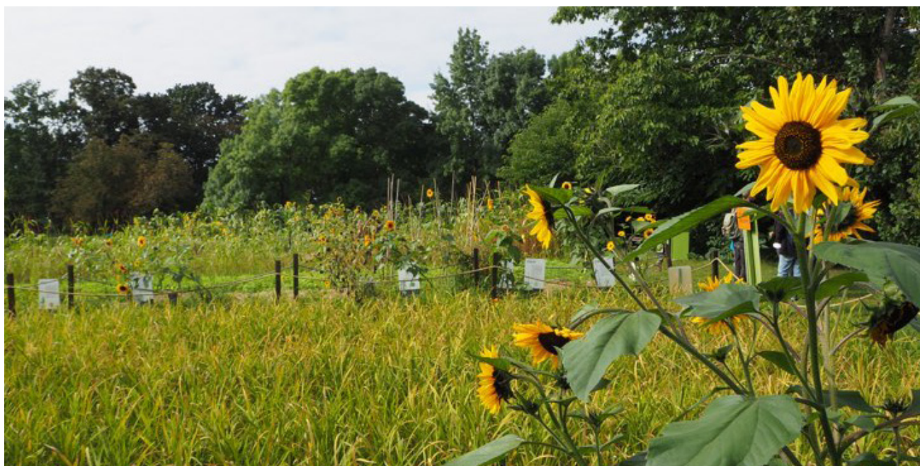
Weltacker i Berlin bedriver folkbildning om hur mycket mark och resurser produktionen av olika livsmedel kräver. Resursstarka personer utnyttjar en betydligt större yta än de 2000 m 2 som varje människa skulle ha till sitt förfogande om vi delade lika.