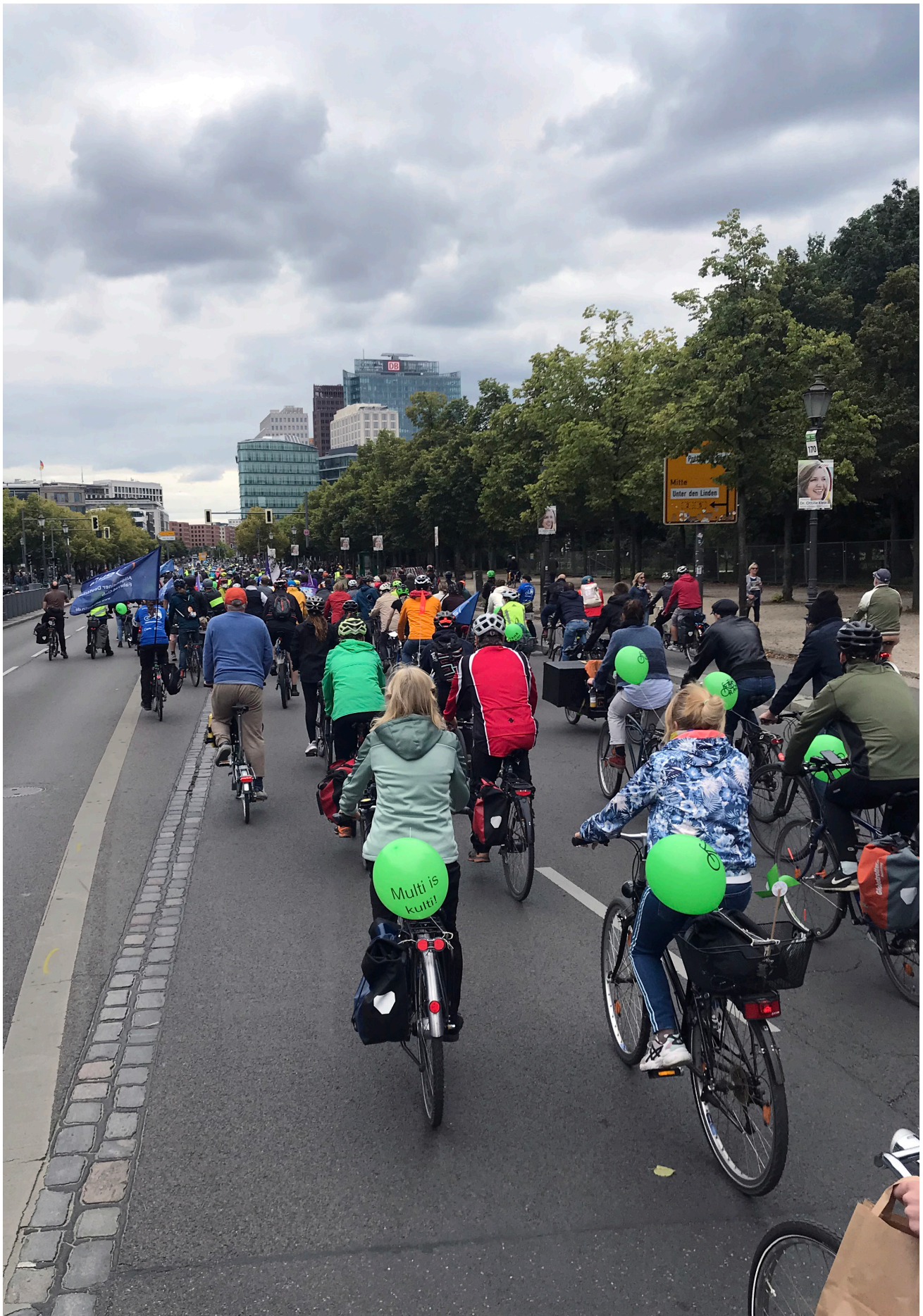
Genom större cykeldemonstrationer som denna kan cykelaktivister både synliggöra alternativ till hur stadens gator vanligen används och föra fram mer konkreta önskemål.