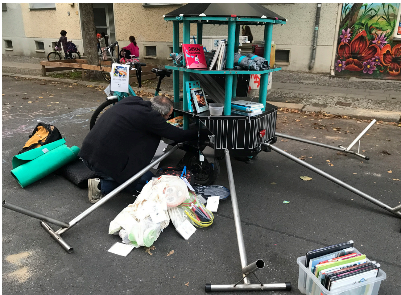
I Berlin samordnar Bündnis Temporäre Spielstraßen medborgarinitiativ som tillfälligt ställer om en bostadsgata för barns lek och umgänge. I det här fallet bidrog stadsdelsbiblioteket med ett mobilt barnboksbibliotek.

Vilka är lärdomarna vi kan ta med oss från våra undersökningar av gräsrotsinitiativ i Göteborg och Berlin? I avsnitten om möjliga strategier för gräsrotsinitiativ och hur kommuner kan samarbeta med initiativen, har vi visat att gräsrotsinitiativen är en viktig del av omställningen. Men har vi råd med dem i tider av hårt pressade kommunala budgetar och en kommersialiserad fastighetsmarknad? Och hur ska deras budskap om en solidarisk och hållbar ekonomi kunna stå sig i ett massmedielandskap som är beroende av att pumpa ut reklam och livsstilsartiklar som främjar vad vi har kallat för "banal konsumism"?