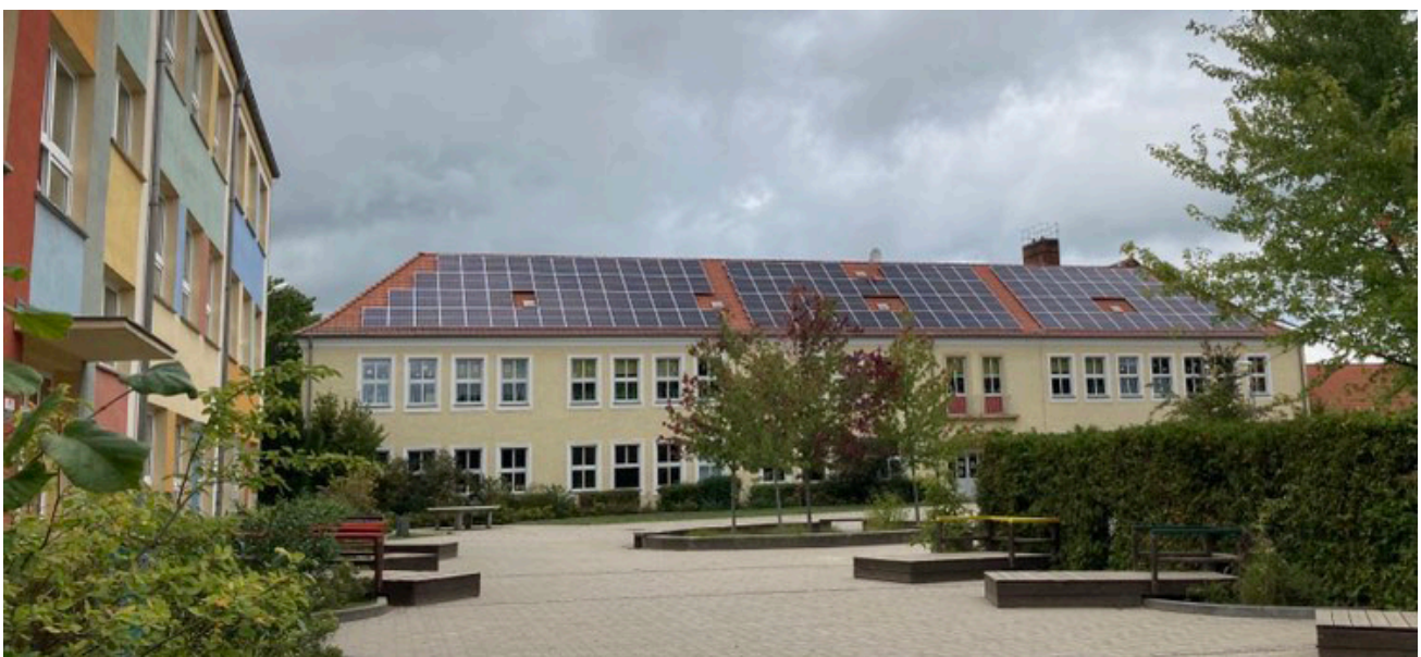
Energikooperativet BürgerEnergie Oder-Spree har finansierat solpaneler till byskolan i Heinersdorf utanför Berlin.

Vilka lärdomar gräsrotsinitiativ kan dra av vår studie beror på deras mål, särskilt hur de värderar sina möjligheter att nå ut bredare, respektive sin autonomi. Gräsrotsinitiativ behöver naturligtvis inte vänta på att bli sanktionerade eller utvalda till att bli kommunala partners, utan kan själva bestämma vilken form av relation och samverkan de ska söka med en kommun. Vår analys tyder på att om avsikten är att nå bortom de som redan är engagerade, då är någon form av engagemang med kommunen troligen effektivt.